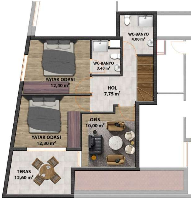
DUBLEKS ÜST KAT PLANI