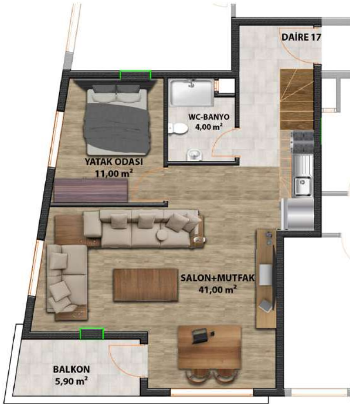
DUBLEKS ALT KAT PLANI